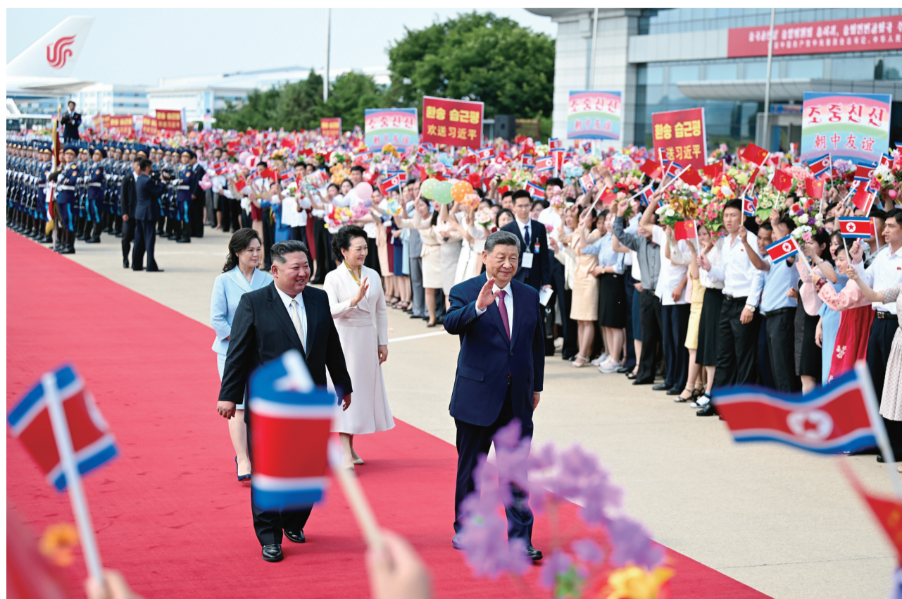
当地时间6月9日下午，中共中央总书记、国家主席习近平结束对朝鲜的国事访问离开平壤。朝鲜劳动党总书记、国务委员长金正恩和夫人李雪主到机场送行，为习近平和夫人彭丽媛举行隆重的欢送仪式。

新华社北京6月9日电 6月9日下午，中共中央总书记、国家主席习近平在圆满结束对朝鲜国事访问后回到北京。