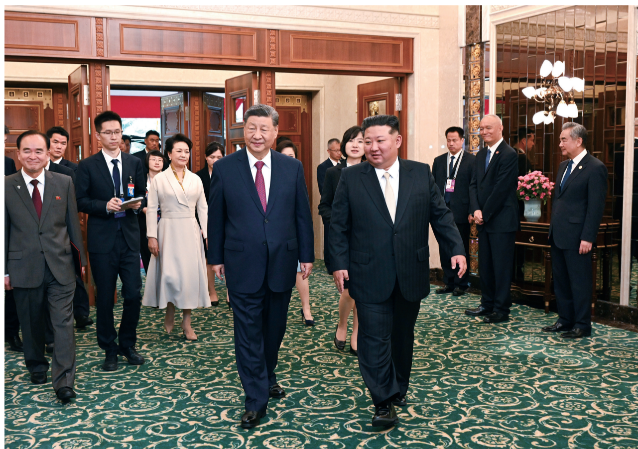
当地时间6月9日，中共中央总书记、国家主席习近平和夫人彭丽媛在平壤锦绣山迎宾馆出席朝鲜劳动党总书记、国务委员长金正恩和夫人李雪主举行的小范围午宴。