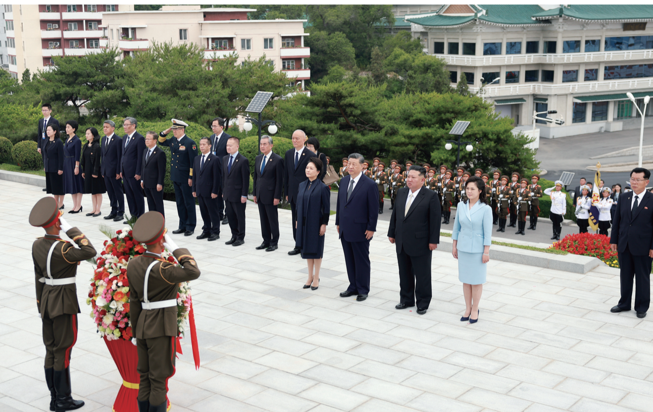
当地时间6月9日上午，正在朝鲜进行国事访问的中共中央总书记、国家主席习近平和夫人彭丽媛参谒中朝友谊塔。朝鲜劳动党总书记、国务委员长金正恩和夫人李雪主陪同。