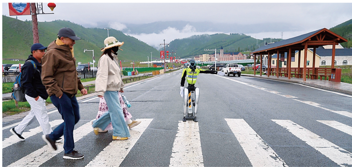
智能交警机器人“喀小安”在喀纳斯贾登峪游客服务中心斑马线处疏导游客过马路。