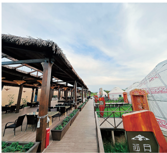
喀纳斯白桦林野奢营地。