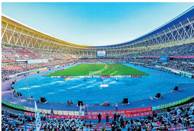
5月16日,2026“同心杯”新疆足球超级联赛开幕式在乌鲁木齐奥体中心举行。

随后,疆超联赛主题曲《同心逐梦》唱响赛场,弹拨尔、艾捷克、萨塔尔等民族乐器奏响,歌词中融入“攒劲”“儿子娃娃”“劳道”等具有新疆烟火气的方言词句,唱出了新疆儿女的豪情与担当,瞬间点燃全场气氛。