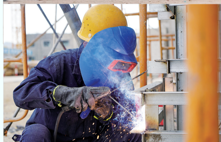
5月9日,施工人员在新疆宏信建设工程有限公司承建的富蕴县额河大观小区项目建设现场进行焊接作业。