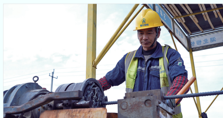
5月7日,富蕴县新疆蕴开10亿化成箔项目施工现场,工人对钢筋进行加工塑形。