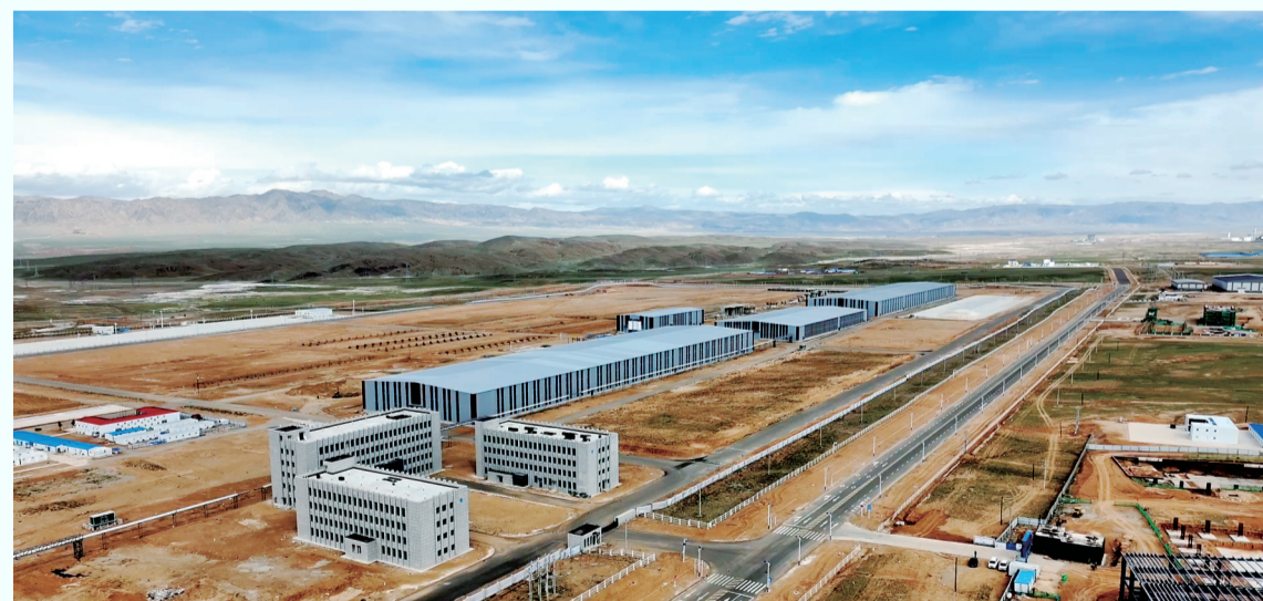
5月8日,黑龙江富蕴工业园区在建项目现场处处涌动着大干实干、聚力发展的强劲热潮。