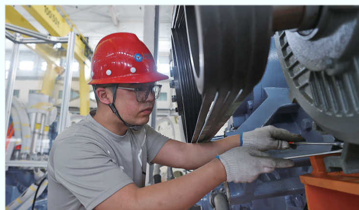
5月8日,布尔津县工业园区运达绿动新能源项目生产车间里,工人有序开展生产作业。