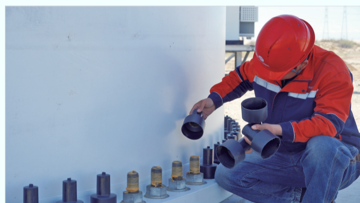
5月6日,在国家电投哈巴河27万千瓦风电项目现场,施工人员对风机进行调试。