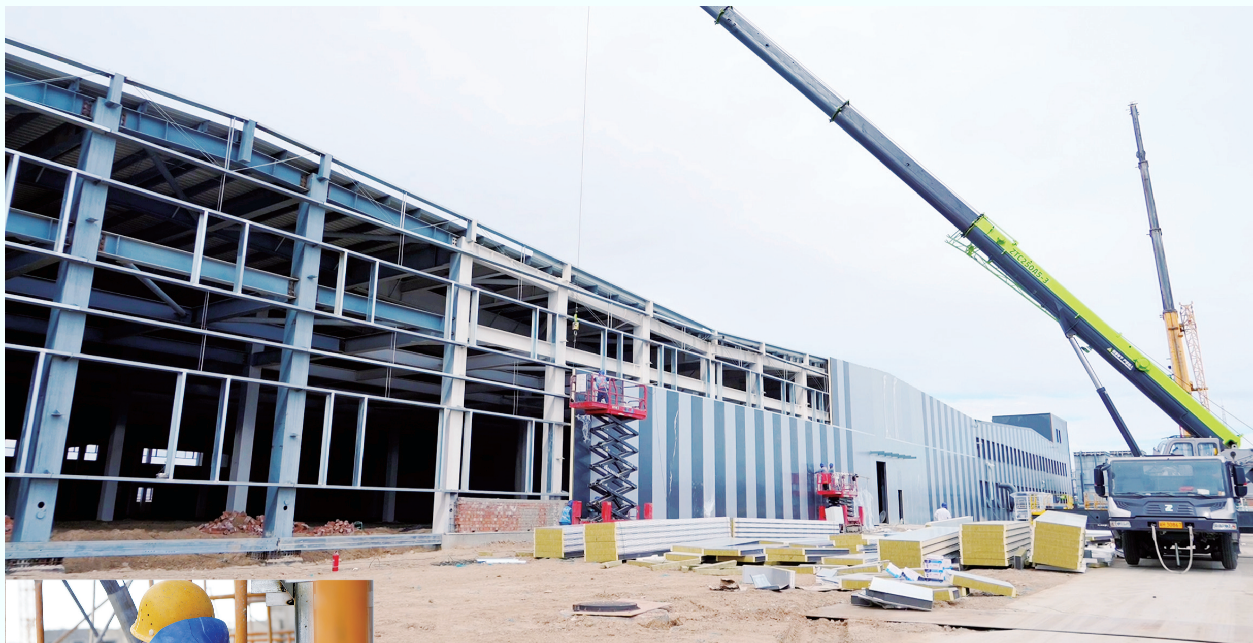
5月7日,富蕴县数据中心综合应用示范项目建设现场,施工单位压茬推进厂房施工、平台搭建等工作。