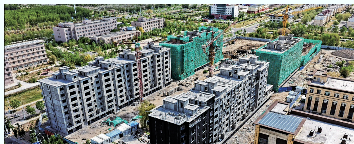
5月9日,福海县海星湾小区建设如火如荼。