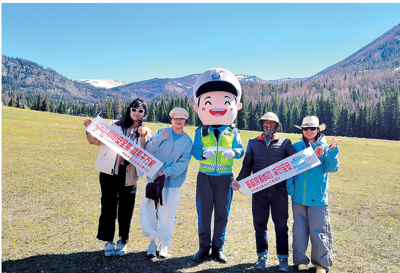
执勤民警化身平安宣传员,向游客宣传交通安全知识。

同时,该大队紧扣“游新疆平安行”活动要求,将交通安全宣传、便民服务与互动体验有机融合,让安保工作更有温度。执勤民辅警化身平安宣传员、旅游服务员,向过往游客发放交通安全宣传资料,细致讲解山区弯道多、坡度陡、气候多变环境下的行车安全知识,重点提醒杜绝疲劳驾驶、超员超载、违规停车等交通违法行为;创新互动形式,骑警队员贴心引导游客体验骑马乐趣,在轻松愉快的互动中拉近警民距离,展现雪都交警的为民情怀。