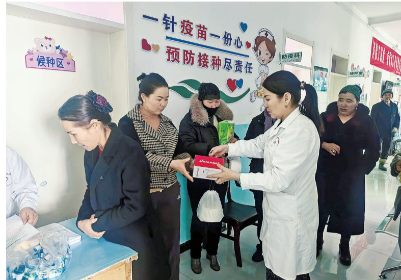
吉木乃县组建县级专家流动团队,将“两癌”筛查与全民健康体检深度融合,深入牧区为妇女提供上门筛查服务,实现“一次体检、多项受益”。

本报讯(记者 胡俊秀)连日来,地区各级各部门立足职能定位,将树立和践行正确政绩观学习教育与民生实践深度融合,组织党员干部下沉一线,察实情、解民忧、办实事,推动学习教育在金山大地落地生根、开花结果。