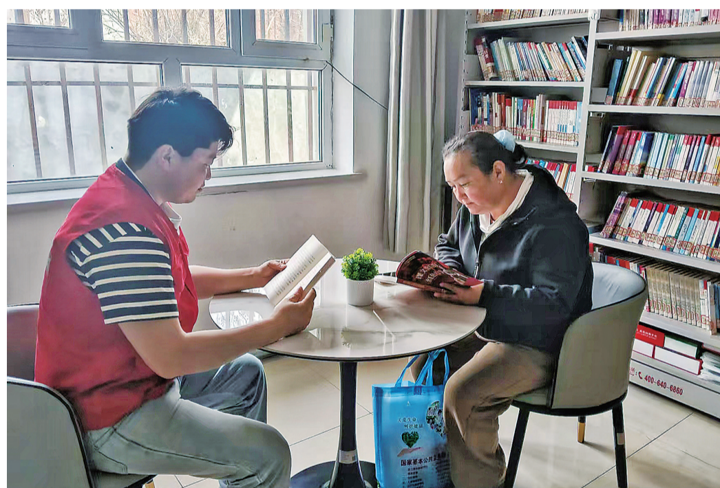
阿克阿依日克村村民在农家书屋内阅读。