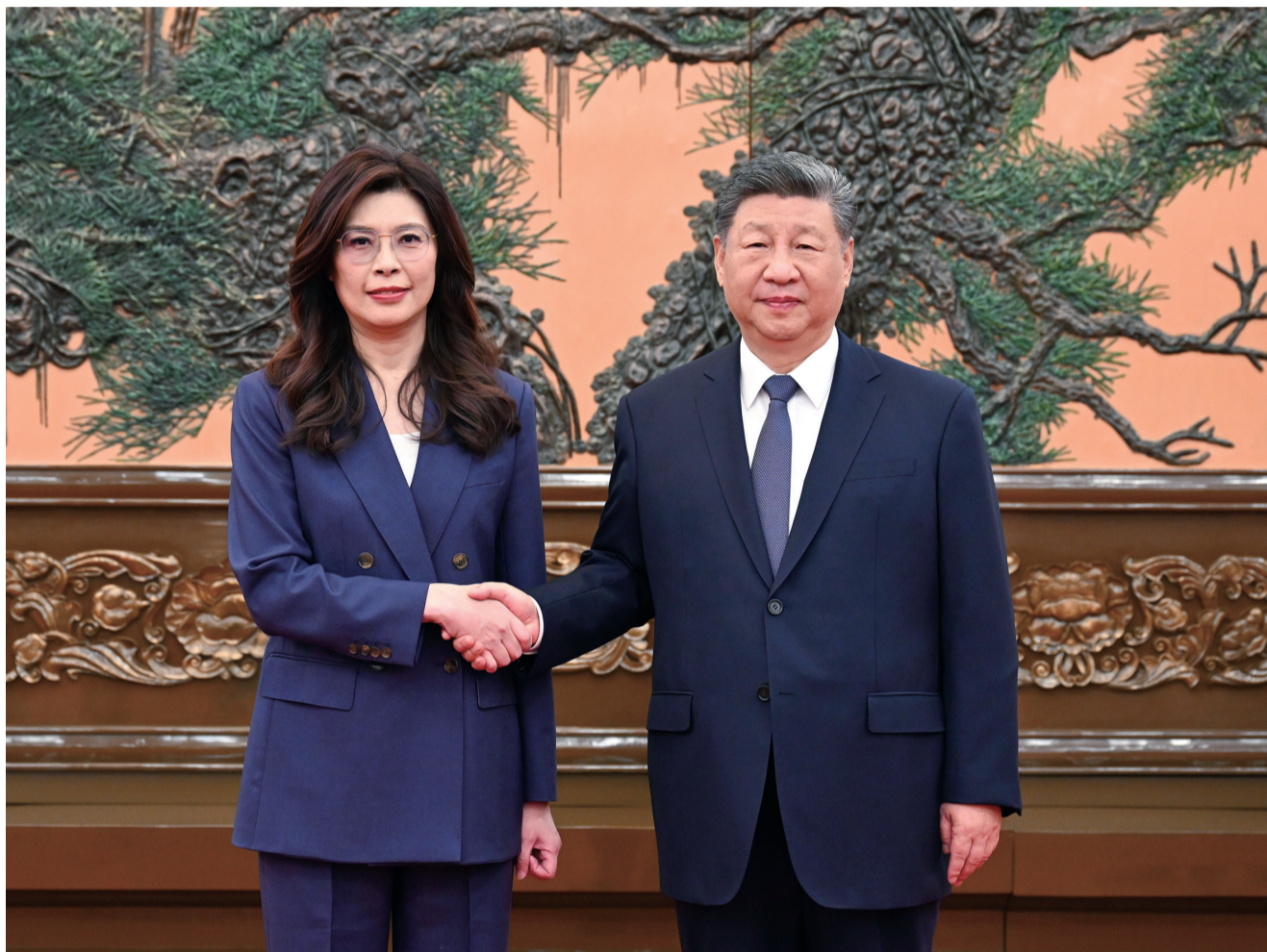
4月10日上午，中共中央总书记习近平在北京会见郑丽文主席率领的中国国民党访问团。

第二，坚持以和平发展守护共同家园。大陆和台湾同属一个中国，中国是中华民族的共同家园。两岸同胞要守好、建设好这个共同家园，根本在于坚持“九二共识”、反对“台独”，核心是认同两岸同属一个中国。家和万事兴。只要是有助于两岸关系和平发展的主张我们都欢迎，只要是有助于两岸关系和平发展的事我们都会尽力去做。“台独”是破坏台海和平的罪魁祸首，我们决不姑息、决不容忍。国共两党、两岸同胞要坚持民族大义，反