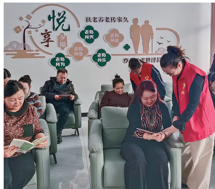
志愿者与社区居民共读红色经典。

如今,吴林英又带领团队开拓国际市场,让旺源驼乳远销欧美、东南亚等地,成为新疆特色农产品的亮丽名片。“新生产线已稳定运行,我们会长期监控,确保生产工艺和产品质量稳定,为产品销售和货架期提供有力的溯源与数据支撑。”吴林英表示,未来将继续深耕驼乳产业,用创新与坚守,为家乡发展贡献更多力量。