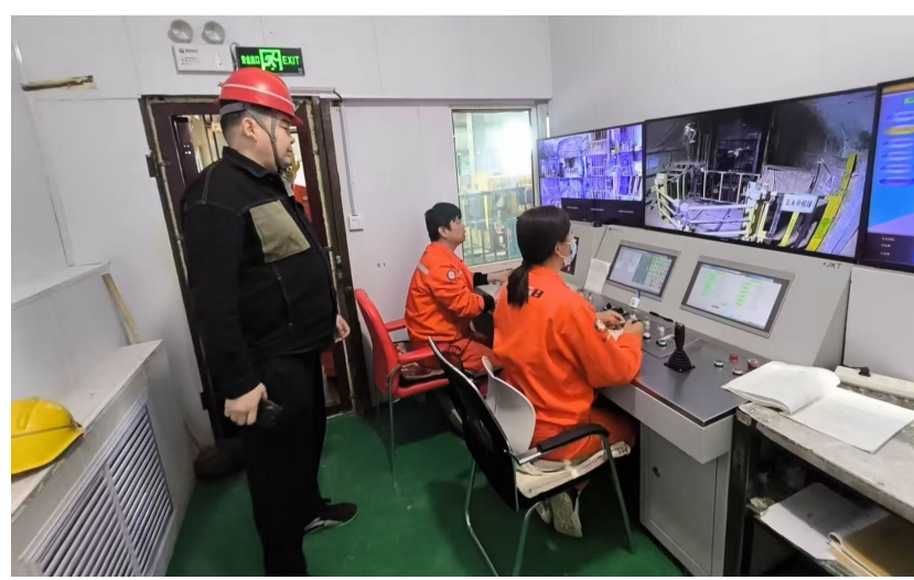
哈巴河县应急管理局打造“AI智能赋能+多维度监管+高效应急联动”智慧监管体系。

聚焦群众急难愁盼,才能让学习教育更有温度。阿勒泰市着力补齐精准服务群众的短板弱项,创新开设“人大代表直播间”,依托线上直播平台,打通政策宣讲、民意收集、诉求办理闭环渠道,真正把惠民政策送到群众身边,把群众诉求落在实处。学习教育开展以来,已有6名各级人大代表参与直播4场,吸引6200人在线观看,点赞31万次,单场直播最高在线观看2430人次。同时,建立“民情速递”快速处置机制,对收集到的民情诉求、意见建议进行整理归类,及时移交相关职能部门跟进办理,限期办结,全程跟踪督办、闭环管理,确保件件有回音、事事有着落。直播共收集转办各类民情诉求12件,均已对接对应部门推进处置,以实打实的行动化解民忧、纾解民困。