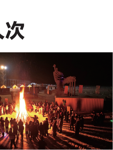
游客参加篝火晚会。

烟火气十足的配套活动,成为本届冬捕节圈粉的重要加分项。这里既有冬泳挑战赛、雪地足球、冰上龙舟等动感竞技项目,又有当地少数民族家访、刺绣展示等民俗体验,还有老少皆宜的打雪仗、马