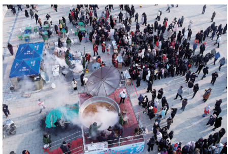
大锅“鱼羊鲜”鲜汤免费供游客品尝。

银冰映笑颜,福鱼兆丰年。如今的乌伦古湖冬捕节,早已超越了捕鱼本身,成为串联生态之美、人文之韵与发展之姿的纽带。热情的福海人民正以最饱满的姿态,邀请八方宾朋在冰雪世界里邂逅渔猎乐趣、品味特色美食,感受多元文化交融之美。