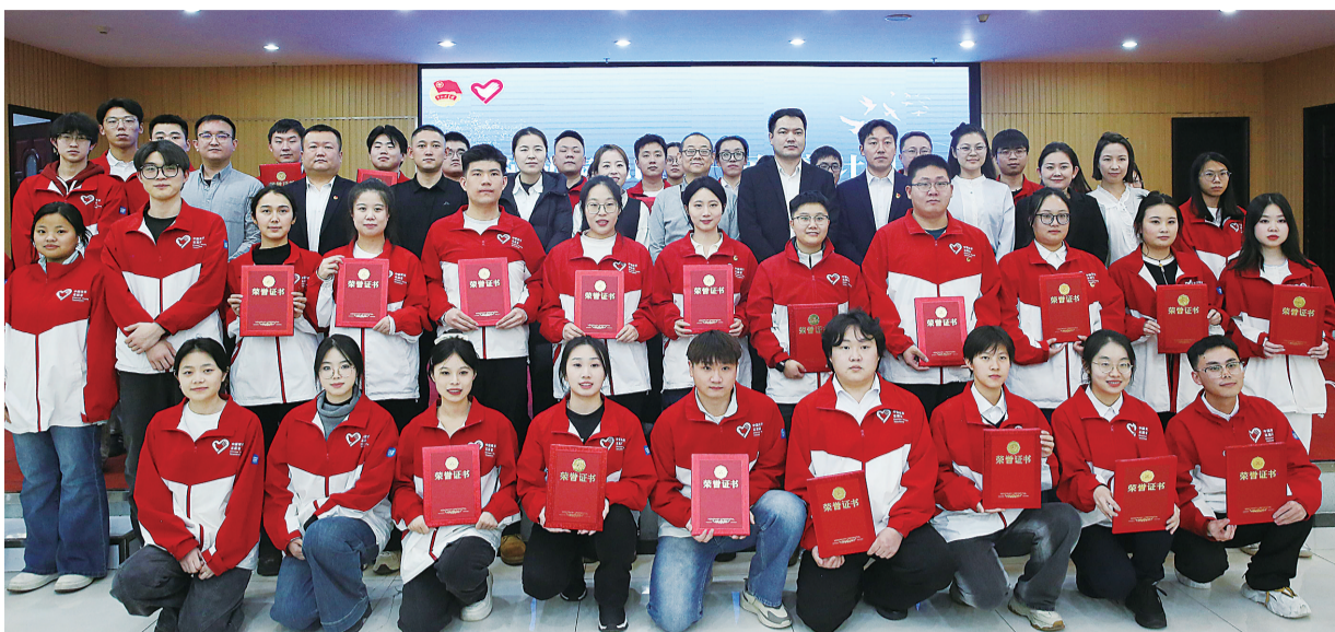
地区第一届西部计划志愿者职业规划大赛决赛后集体合影留念。

比赛现场气氛热烈。个人展示环节,选手们结合自身志愿服务经历,分享基层实践中的成长感悟、企业参访后的行业认知,清晰阐述职业目标设定与发展路径规划,把青春理想与西部发展需求紧密结合;方案讲解环节,选手们精准阐述所提交方案的核心思想,讲解结构层次分明、逻辑严谨,充分体现所在赛道的专业知识、分析方法和专业思维;评委问答环节,评审团围绕职业规划合理性、岗位适配度等核心维度精准提问、专业点评,为选手们提