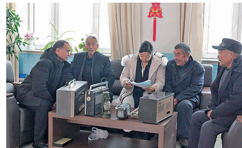
吉木乃县乌拉斯特镇强德珠尔村村民自发送上家中老物件。通讯员 别尔德别克·纳仁汗 摄

本报讯(记者 古扎丽·阿布都热西提)一方水土蕴乡愁，一件旧物藏光阴。日前，吉木乃县乌拉斯特镇强德珠尔村新时代文明实践站发起“诚邀共献老物件，留住乡村旧时光”老物件及老照片征集展示活动，旨在以承载岁月记忆的实物为媒介，“打捞”乡村发展印记，唤醒群众的乡土情怀。