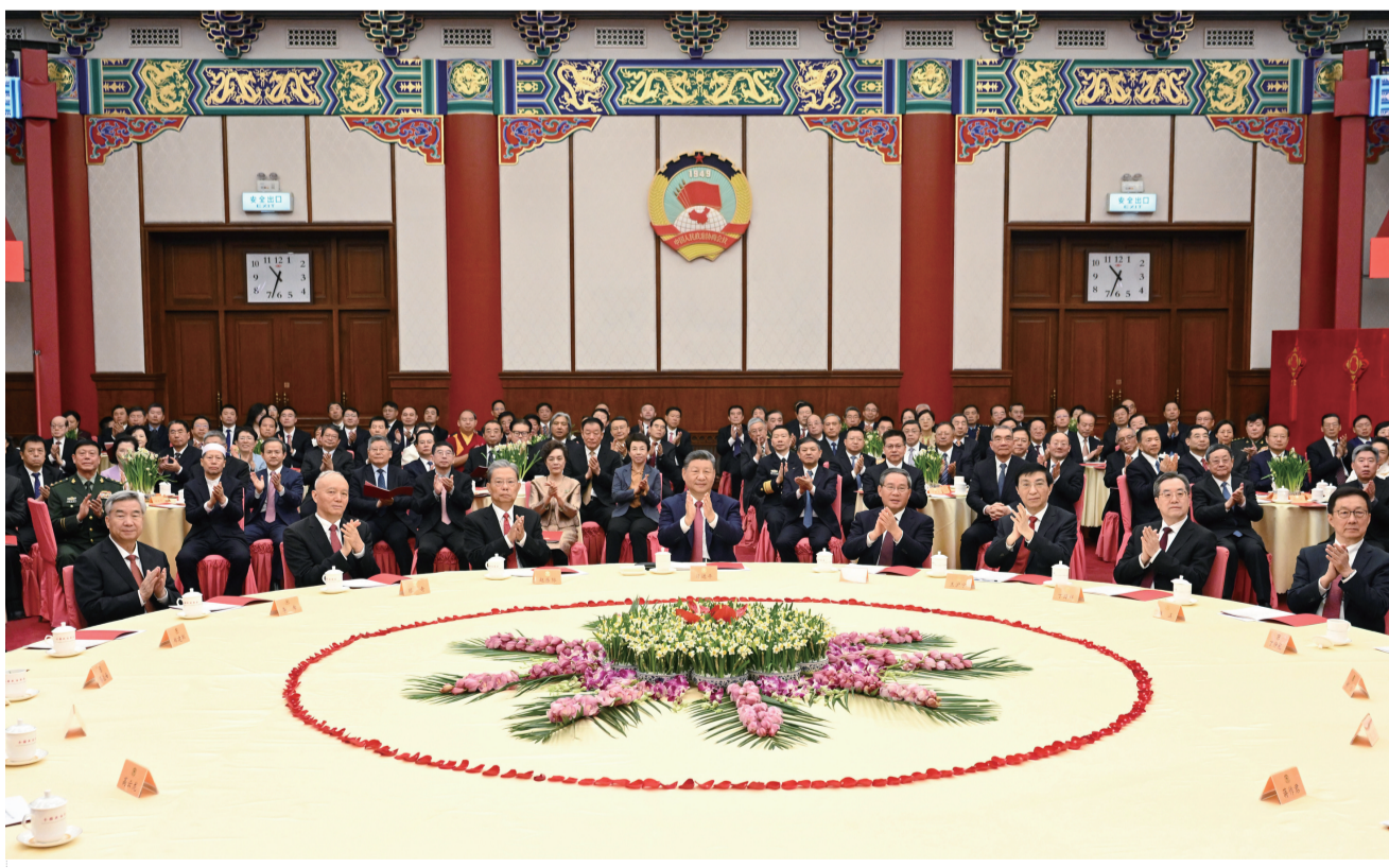
2025年12月31日，全国政协在北京举行新年茶话会。党和国家领导人习近平、李强、赵乐际、王沪宁、蔡奇、丁薛祥、李希、韩正出席茶话会并观看演出。

习近平强调，一年来，人民政协认真贯彻落实中共中央决策部署，着力巩固团结奋斗的共同思想政治基础，紧紧围绕进一步全面深化改革、推动高质量发展等议政建言，为党和国家事业发展作出了新贡献。