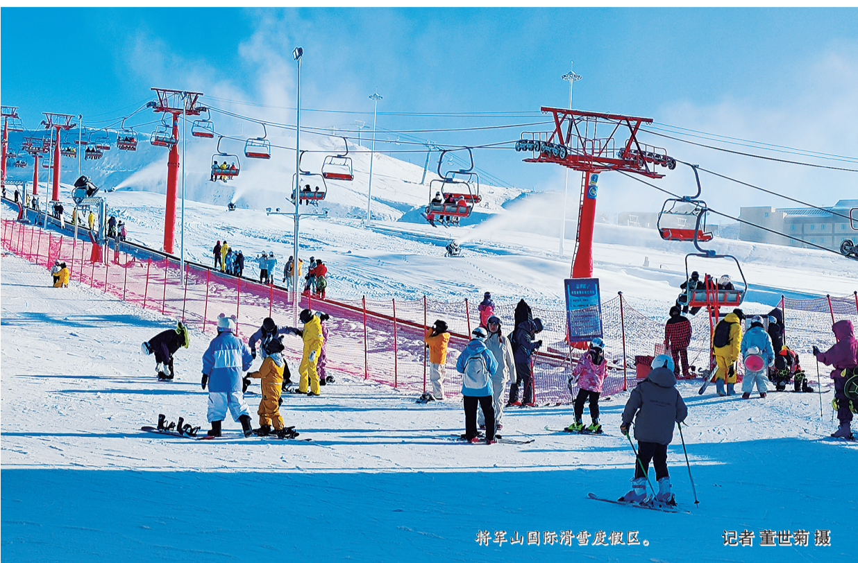
将军山国际滑雪度假区。

为孩子们度过一个充实有趣、收获满满的雪假,地区各县市文旅部门精准对接学生及家长需求,联动四