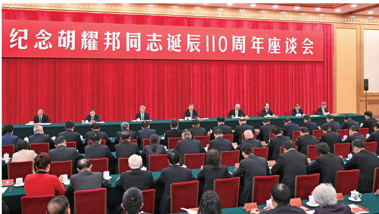
11月20日，中共中央在北京人民大会堂举行纪念胡耀邦同志诞辰110周年座谈会。习近平、蔡奇、李希等出席座谈会。

习近平强调，胡耀邦同志积极倡导和推进改革开放，为推动社会主义现代化建设倾注了大量心血。全党同志要像他那样勇立时代潮头、锐意改革创新，用啃硬骨头的精神进一步全面深化改革，