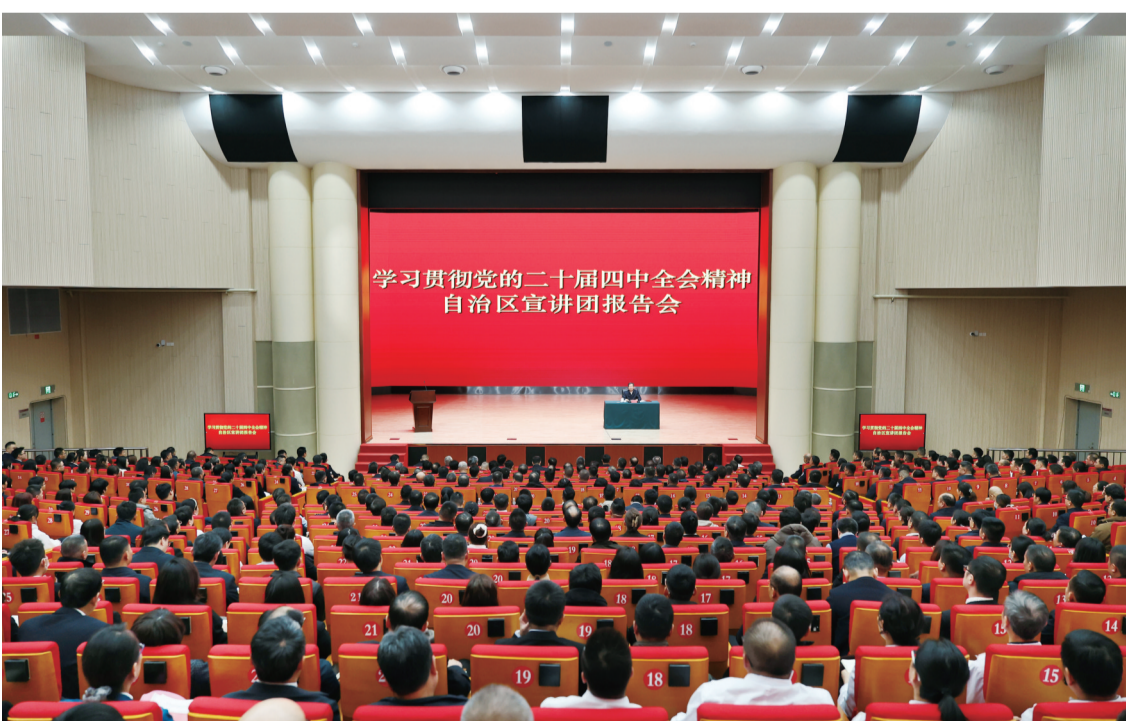
十一月十九日，自治区党委书记、自治区宣讲团团长陈小江在克拉玛依市宣讲党的二十届四中全会精神。

陈小江强调，在党中央坚强领导和习近平总书记亲切关怀下，新疆推动高质量发展迈出坚实步伐，面临难得历史机遇。我们要进一步深刻领会“两个确立”的决定性意义，坚决做到“两个维护”，全面学习贯彻四中全会战略部署，牢记嘱托、接续奋斗，完整准确全面贯彻