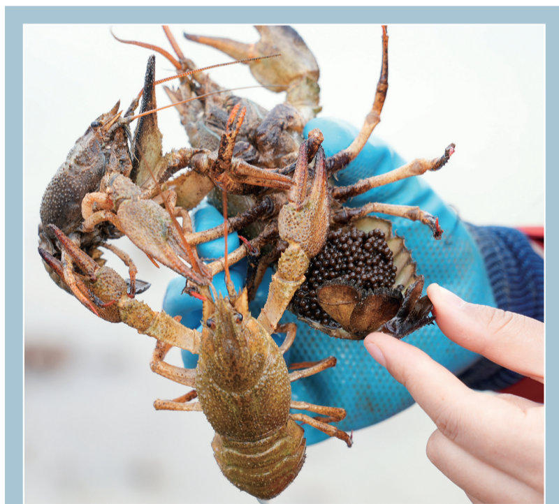
工作人员展示抱卵额河螯虾。

2024年5月，科研团队首次实现额河螯虾胚胎离体孵化，把孵化率提升至80%以上，周期缩短10天，该技