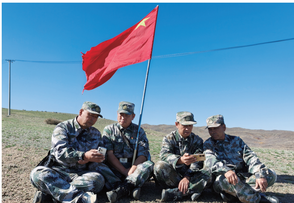
吉木乃县吉木乃镇萨尔乌楞村护边员收看新疆维吾尔自治区成立70周年庆祝大会盛况。

本报讯(记者 常轶茹 古丽娜·阿布都热西提 张楠 董发勇 董世菊 阿尔达克·拜斯汗 胡俊秀 张福新 代利 古丽娜 实习记者 彭林海 马海娜·马格力 王景鸿 包洪宇 通讯员 李森 加尔恒·阿尔帕 王呈 刘金锐 叶尔肯·扎合帕尔)巍巍天山流彩,莽莽昆仑尽欢颜。9月25日上午10时30分,习近平总书记从乌鲁木齐出席新疆维吾尔自治区成立70周年庆祝大会,同新疆各族各界干部群众代表一道,热烈庆祝新疆维吾尔自治区成立70周年。 同一时刻,66.8万金山儿女怀着无比激动的心情,通过电视、广播、网络直播等平台,收听收看庆祝大会盛况。在新疆维吾尔自治区成立70周年的历史性时刻,习近平总书记来了,中央代表团来了,各族群众倍感振奋、备受鼓舞,沉浸在无边的幸福与温暖之中。大家纷纷表示,要像石榴籽一样紧紧抱在一起,不断铸牢中华民族共同体意识,在中国式现代化进程中,努力建设团结和谐、繁荣富裕、文明进步、安居乐业、生态良好的社会主义现代化新疆。 上午10时30分,地委、地区人大工委、行署、地区政协工委组织党员干部集中观看庆祝大会