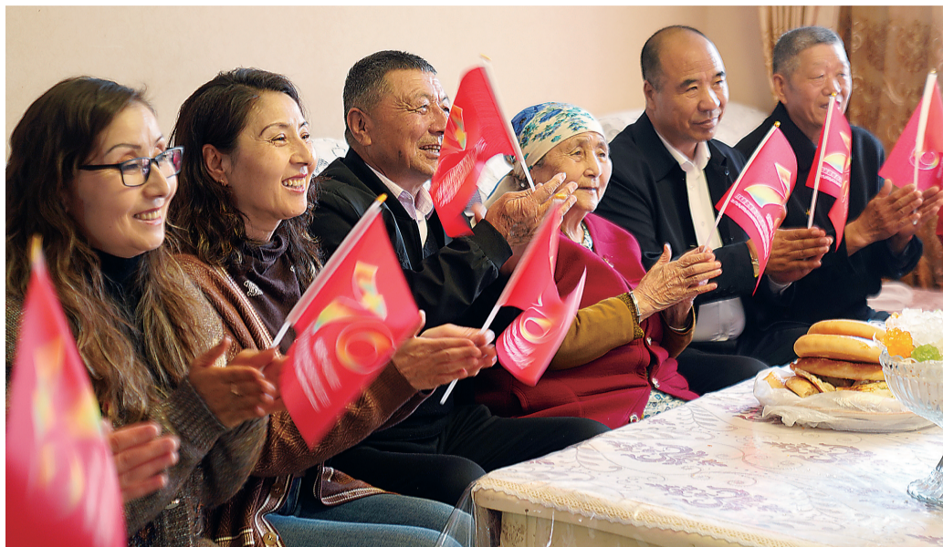
全国道德模范阿尼帕·阿力马洪一家收看新疆维吾尔自治区成立70周年庆祝大会盛况。