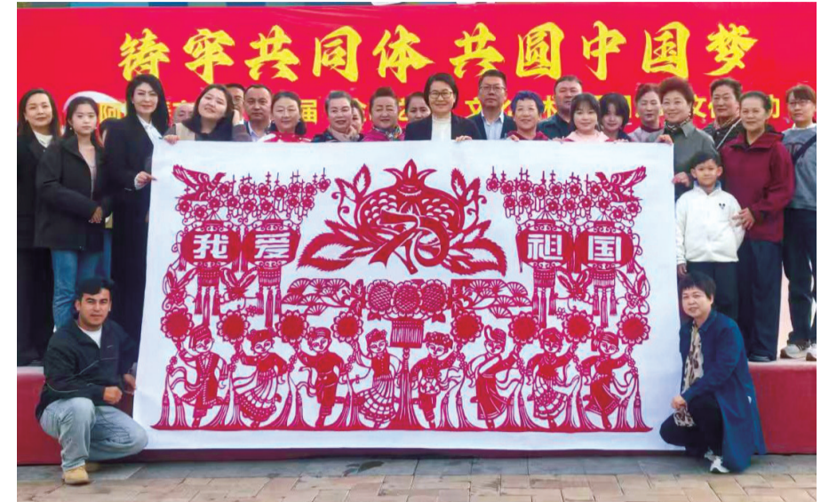
阿勒泰70余人共同创作的《石榴情》剪纸作品。

本报讯(记者 董世菊)9月23日,阿勒泰地区文化馆美术摄影工作室,一幅长3米、宽1.2米的《石榴情》剪纸长卷静静铺展在展台中央,这幅由70余人共创的佳作,正以指尖匠心传递着对新疆维吾尔自治区成立70周年的真挚喜悦,成为馆内“人气展品”。 《石榴情》以“民族团结一家亲,同心共筑中国梦”为主题,用剪纸艺术描绘天山南北发展华章。作品采用中心对称构图,将象征团结的石榴作为核心元素,又巧妙融入多元文化符号:既有各族群众共舞的欢庆场景,也有寓意繁荣的向日葵丰收图景。 “为了把最好的祝福融入作品,从构思到定稿,草图我们就改了不下十次。”阿勒泰地区非物质文化遗产剪纸项目代