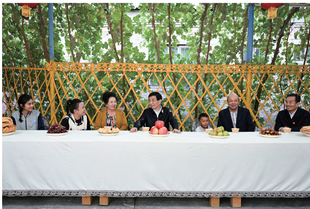
九月二十五日下午,受习近平总书记嘱托,中共中央政治局常委、全国政协主席、中央代表团团长王沪宁带领中央代表团部分成员在巴音郭楞蒙古自治州库尔勒市看望慰问当地各族干部群众。这是王沪宁和中央代表团部分成员在库尔勒市第二十三中学考察教育援疆情况。