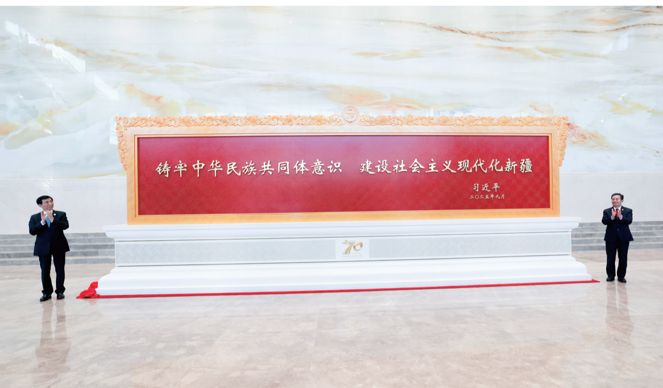
9月25日下午,中共中央政治局常委、全国政协主席、中央代表团团长王沪宁带领中央代表团出席新疆维吾尔自治区赠送纪念品仪式。中央代表团向新疆赠送了习近平总书记题词贺匾、中华同心尊等纪念品。这是王沪宁和新疆维吾尔自治区党委书记陈小龙一同为贺匾揭幕。

祝伟大祖国繁荣昌盛! 祝新疆维吾尔自治区兴旺发达! 祝新疆各族人民幸福安康! (新华社乌鲁木齐9月25日电)