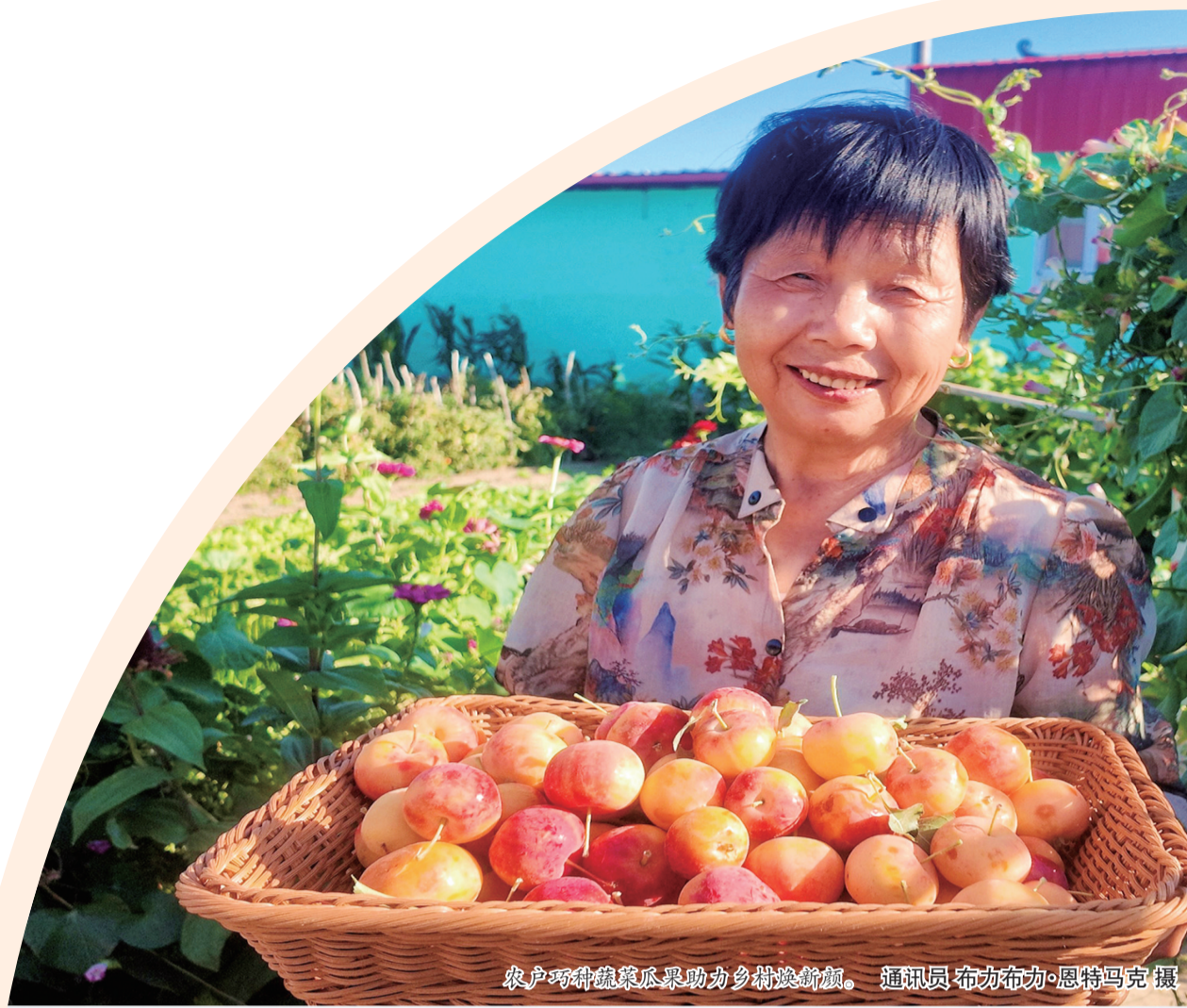
农户巧种脆甜瓜果助力乡村振兴新颜。

(参与记者 古丽娜·阿尔达克·拜斯汗 张涛 朱马别克·卡德尔别克 杨玮璇 古扎丽·阿布都热西提 实习记者 包洪宇)