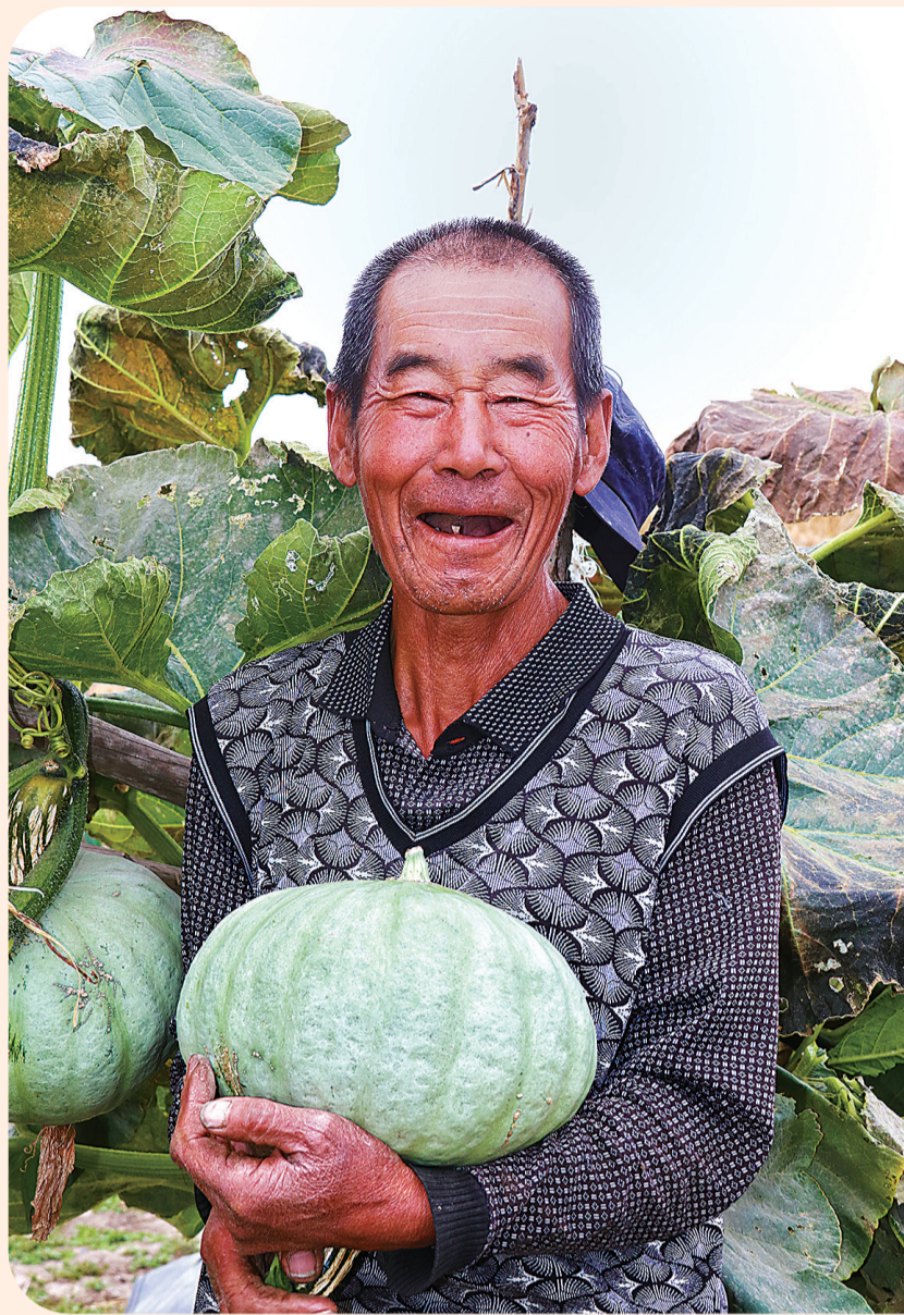
农民喜晒板南瓜。