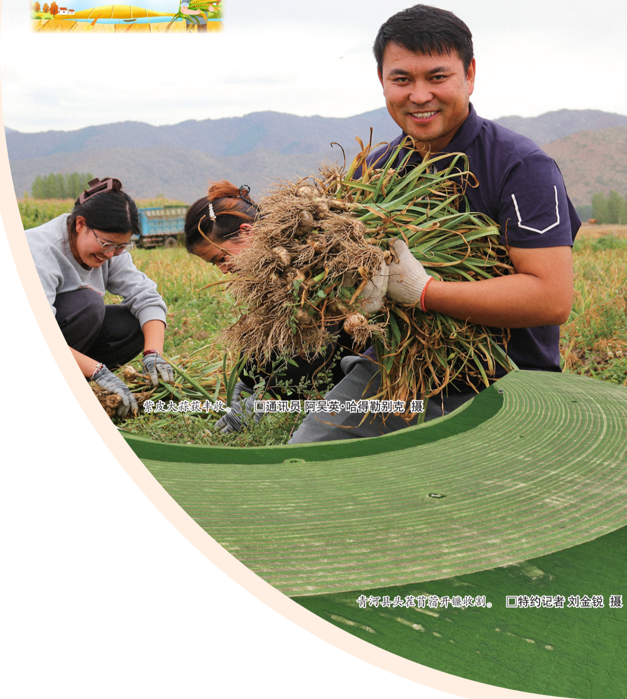
紫皮尖蒜收获。