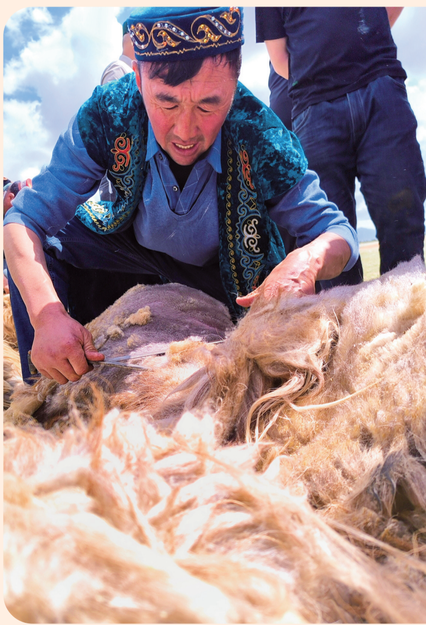
牧民修剪羊毛。