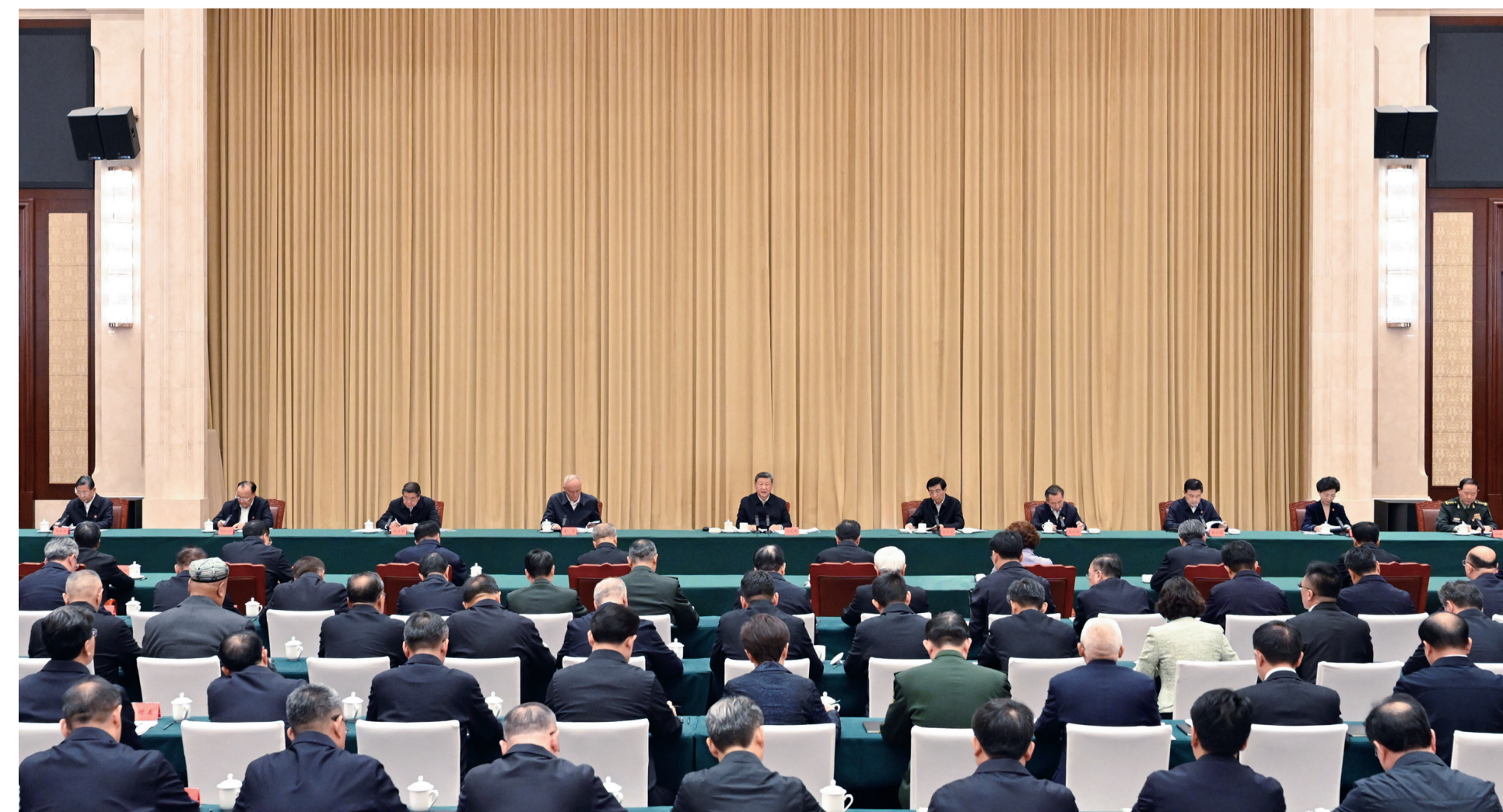
9月24日下午，率中央代表团出席新疆维吾尔自治区成立70周年庆祝活动的中共中央总书记、国家主席、中央军委主席习近平在乌鲁木齐听取新疆维吾尔自治区党委和政府工作汇报，发表了重要讲话。

■ 新疆要完整准确全面贯彻新时代党的治疆方略，坚持稳中求进工作总基调，统筹发展和安全，牢牢扭住社会稳定和长治久安工作总目标，紧紧围绕铸牢中华民族共同体意识、推进中华民族共同体建设，锚定中央赋予的“五大战略定位”，凝心聚力、久久为功，努力建设团结和谐、繁荣富裕、文明进步、安居乐业、生态良好的社会主义现代化新疆