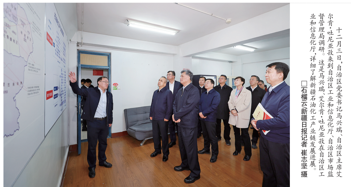
十二月三日,自治区党委书记马兴瑞、自治区主席艾尔肯·吐尼亚孜到自治区工业和信息化厅、自治区市场监督管理局调研。这是马兴瑞、艾尔肯·吐尼亚孜在自治区工业和信息化厅,详细了解新疆石油化工产业链发展进展。