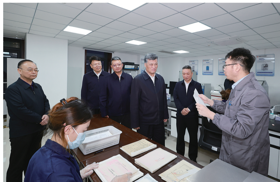
十一月二十六日，自治区党委书记马兴瑞来到自治区党委办公厅管理的密码、通信、保密、档案等二级单位调研。这是马兴瑞在自治区档案馆档案室听取工作介绍。