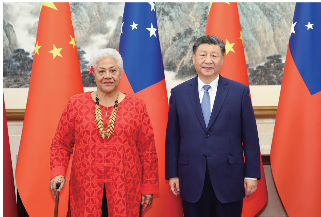
十一月二十六日下午，国家主席习近平在北京钓鱼台国宾馆会见来华进行正式访问的萨摩亚总理菲娅梅。

新华社北京11月26日电 11月26日下午，国家主席习近平在北京钓鱼台国宾馆会见来华进行正式访问的萨摩亚总理菲娅梅。