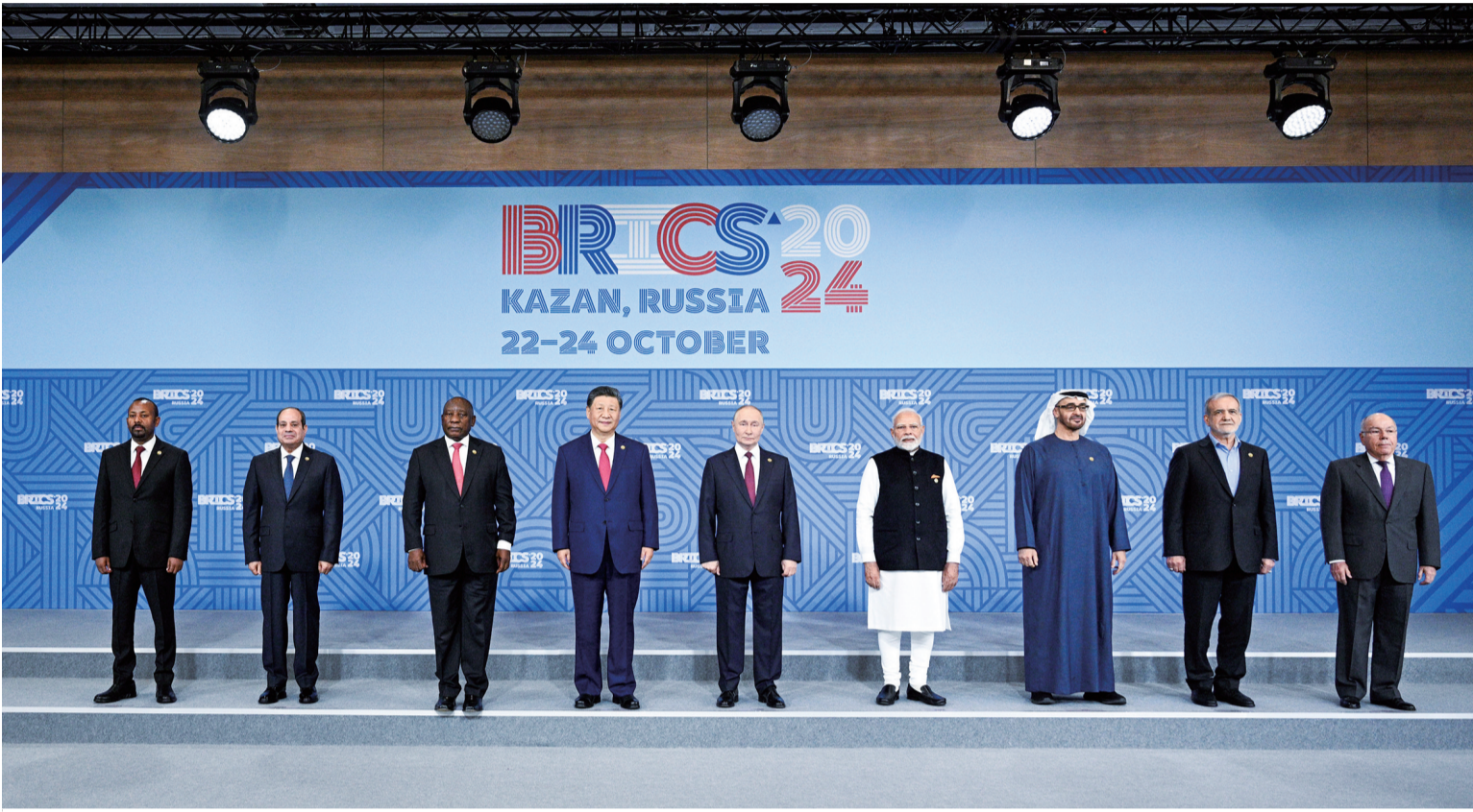
当地时间10月23日上午，金砖国家领导人第十六次会晤在喀山会展中心举行。俄罗斯总统普京主持会晤。中国国家主席习近平、巴西总统卢拉(线上)、埃及总统塞西、埃塞俄比亚总理阿比、印度总理莫迪、伊朗总统佩泽希齐扬、南非总统拉马福萨、阿联酋总统穆罕默德等出席。这是会晤期间，金砖国家领导人集体合影。