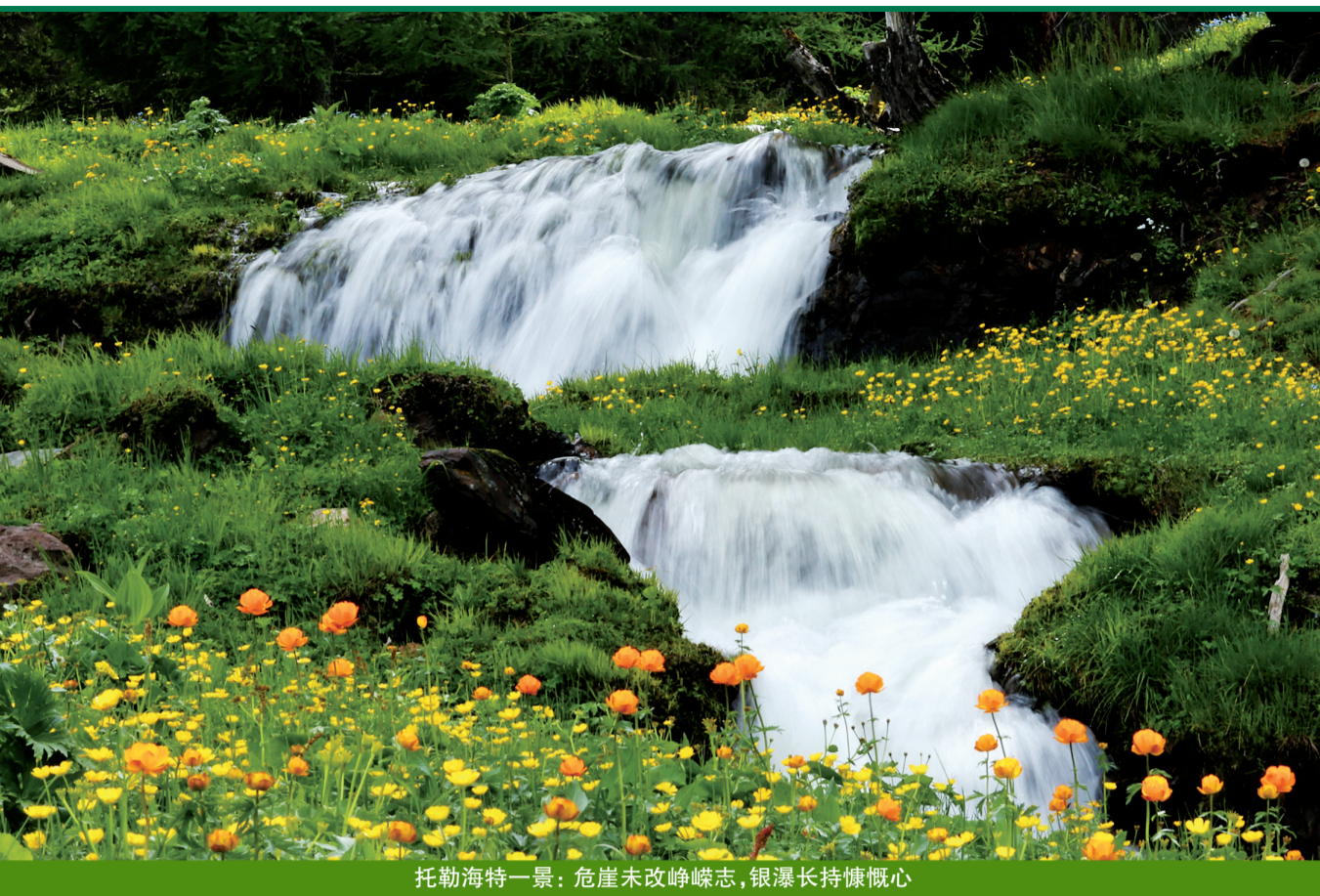
托勒海特一景:危崖未改峥嵘志,银瀑长持慷慨心