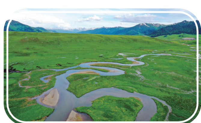
航拍喀拉希力克乡加杂什大草原