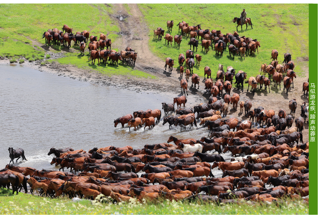
马似游龙疾蹄声动莽原