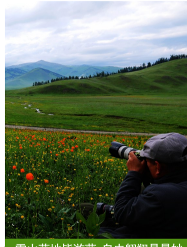
雪山草地皆游荡,自由翱翔是最妙