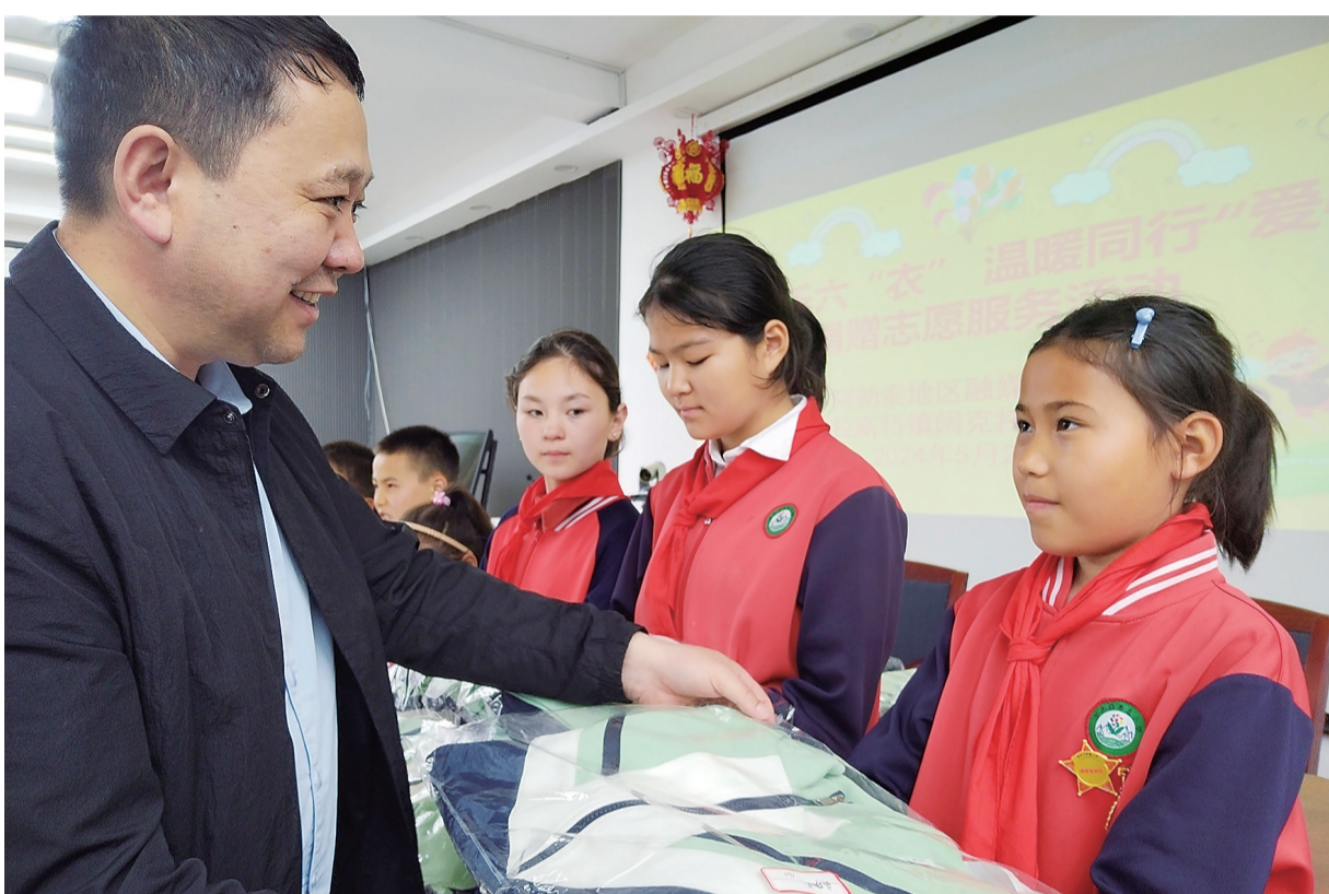
5月28日,地区融媒体中心驻吉木乃县乌拉斯特镇阔托干村工作队联合村委会开展“欢乐六‘衣’温暖同行”爱心捐赠志愿服务。