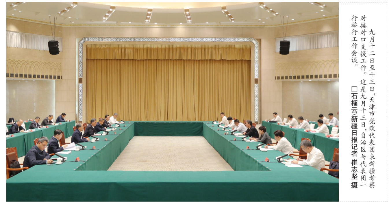
九月十二日至十三日，天津市党政代表团来疆考察对接对口支援工作。这是九月十三日，自治区与代表团一行举行工作会谈。