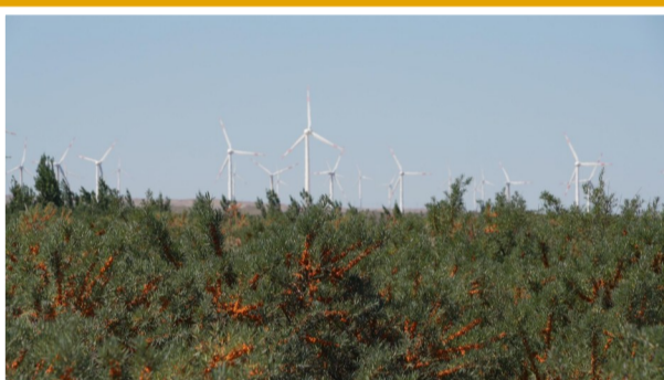
▲汇源布尔津沙棘产业园,一串串金灿灿的沙棘果挂满枝头,粒粒清亮、颗颗饱满。