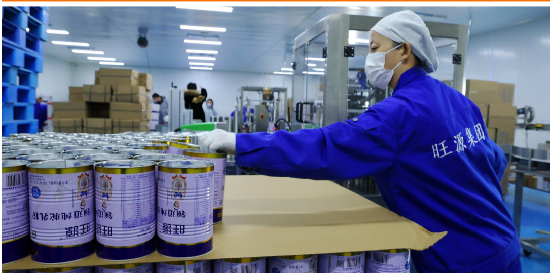
▲位于福海县的新疆旺源生物科技集团有限公司生产车间内,工人们正在流水线上作业。