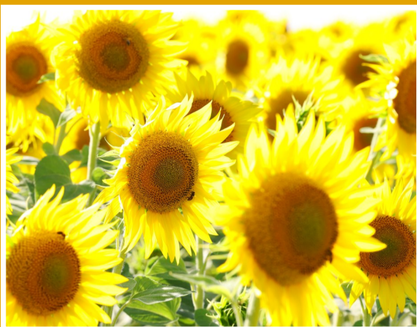
▲阿勒泰市阿苇滩镇,金色的向日葵随风摆动,好一幅乡村美景。