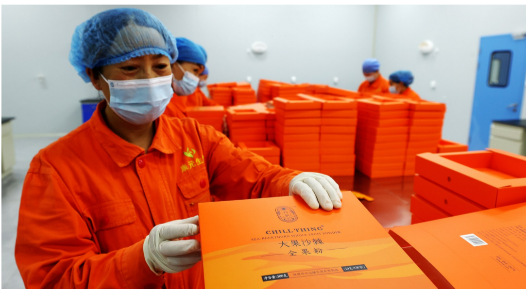
▲哈巴河县工业园区的新疆康元生物技术集团股份有限公司车间内一派忙碌景象。