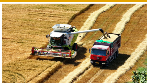
▲吉木乃县乌拉斯特镇阔克齐木灌区麦田,金黄色的麦穗颗粒饱满,收割机来回穿梭,丰收在望。