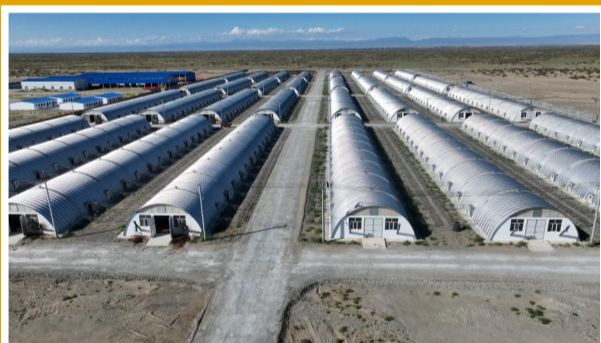
▲哈巴河县新疆北园春众联畜牧科技有限责任公司厂区一角。