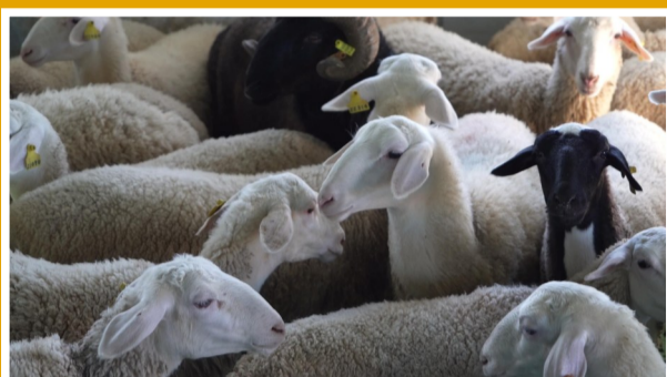
▲哈巴河县新疆北园春众联畜牧科技有限责任公司养殖场内,“咩咩”声此起彼伏。