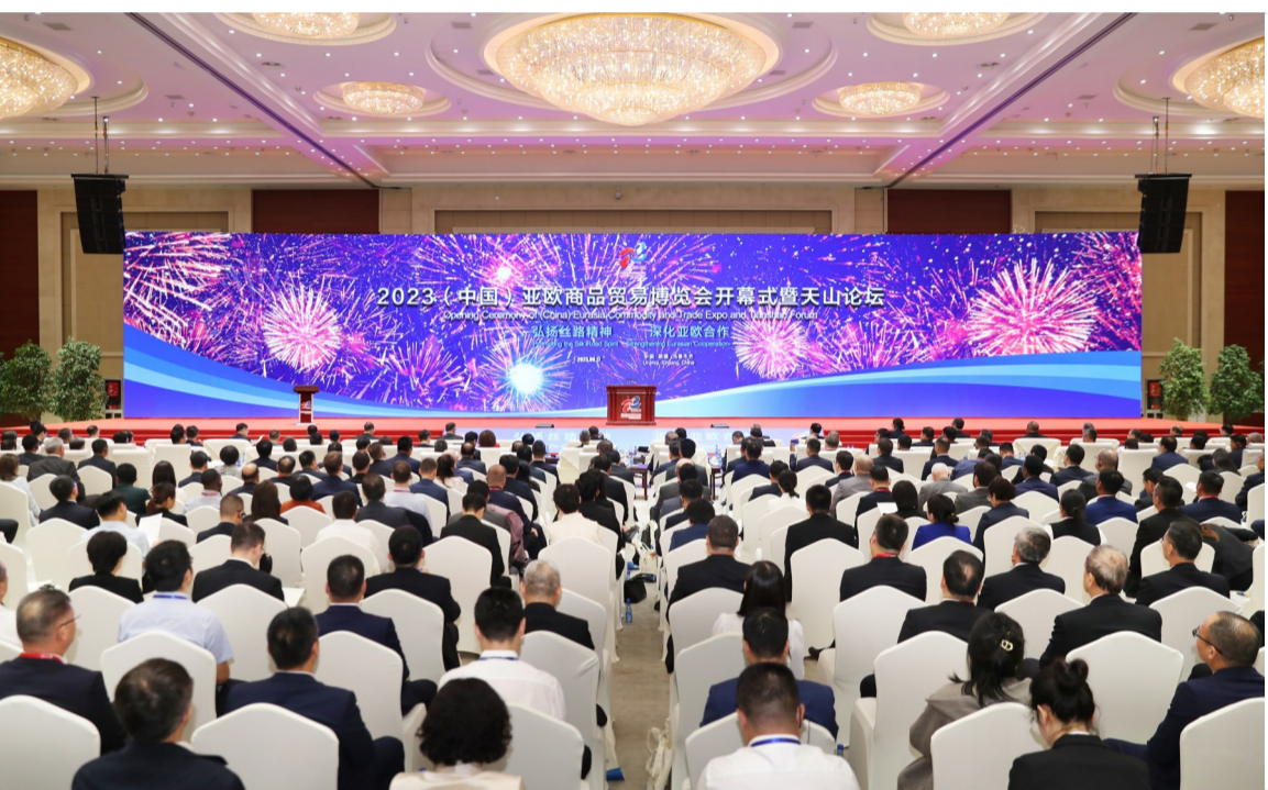
八月十七日,二〇二三年(中国)亚欧商品贸易博览会开幕式在天山论坛新疆国际会展中心举行。

阿·扎帕罗夫 茹曼加林演讲 马兴瑞致辞并宣布开幕 艾尔肯·吐尼亚孜主持 凌激致辞 葛海蛟卡比尔·朱拉佐达樊纲演讲 努尔兰·阿不都满金李邑飞何忠友出席