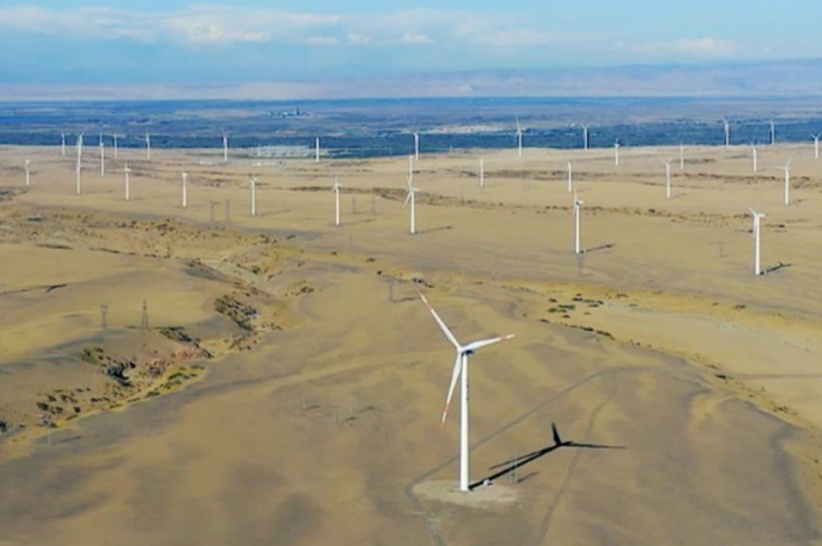
阿勒泰地区融媒体中心

加快建设科技创新平台载体,力争到2025年末,自治区级科技创新平台达到10家。提升科技创新转化能力,每年争取申报自治区科技计划项目30项以上,力争到2025年末,技术合同成交额突破7000万元,入库自治区级科技型中小企业增加至50家、国家级高新技术企业增加至40家。