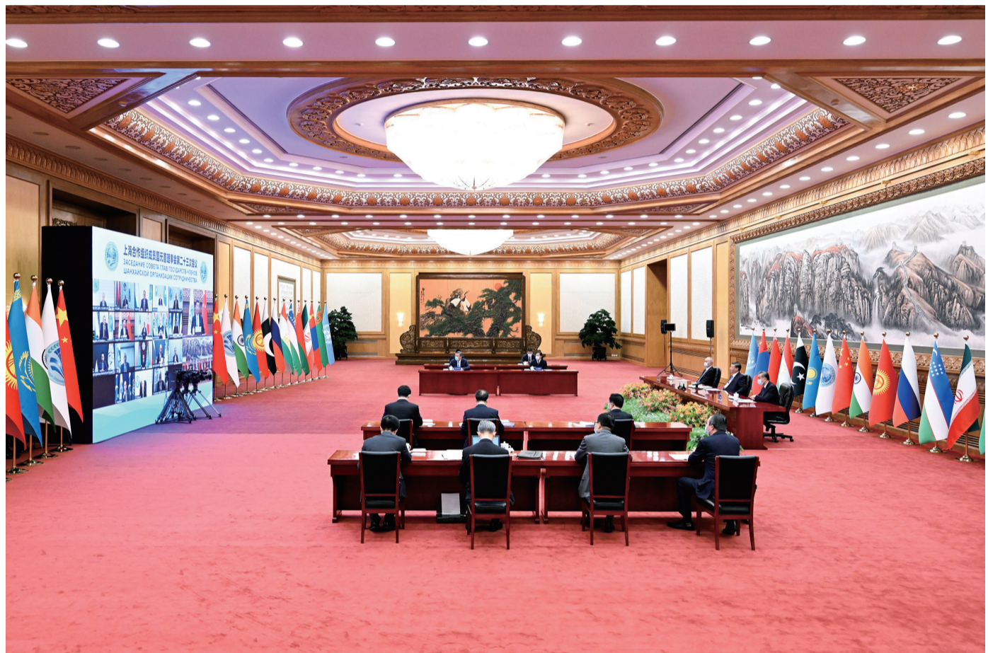
7月4日下午，国家主席习近平在北京以视频方式出席上海合作组织成员国元首理事会第二十三次会议并发表题为《牢记初心使命 坚持团结协作 实现更大发展》的重要讲话。