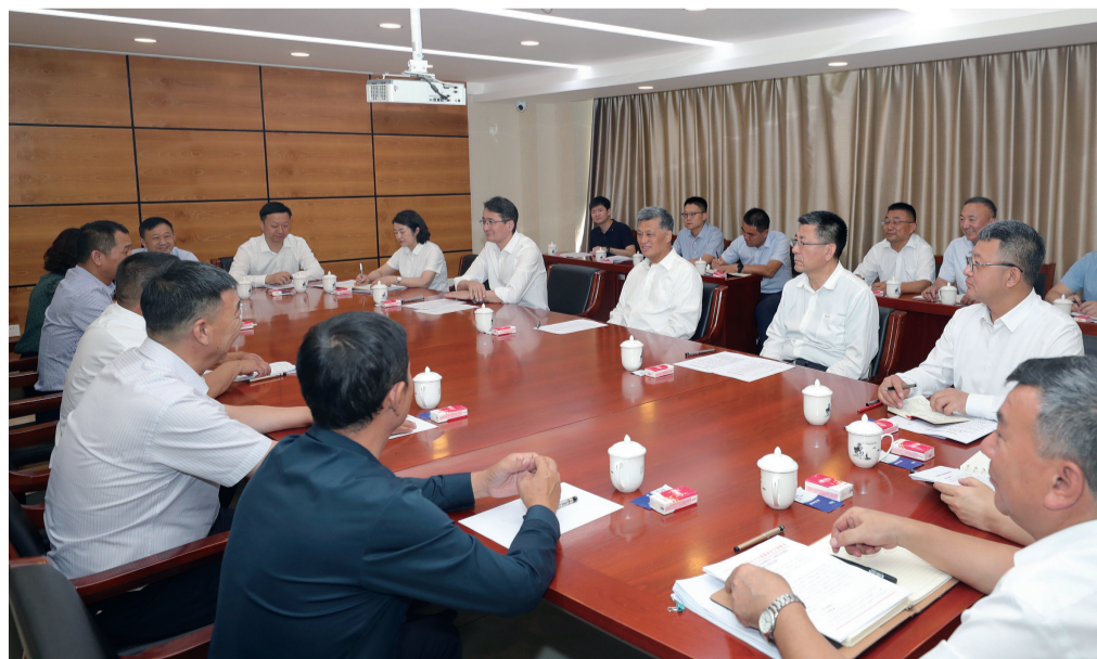
7月4日，自治区党委书记马兴瑞来到自治区人民群众信访服务中心，接待阿克苏地区原社会福利塑料厂职工代表，与大家面对面交流，认真倾听大家诉求，现场研究解决方案措施。

马兴瑞在接待时强调，信访工作是党的群众工作的重要组成部分，是了解社情民意的重要窗口。要深入贯彻落实以习近平同志为核心的党中央决策部署，坚持以人民为中心的发展思想，认真贯彻《信访工作条例》，坚决扛牢为民解难、为党分忧的政治责任，践行新时代“枫桥经验”，学习推广“浦江经验”，扎实做好信访工作，切实为群众排忧解难，以解决群众切身利益问题的实际成效检验主题教育成果，开创新疆信访工作新局面。要站稳群众立场，深入践行党的群众路线，畅通和规范群众诉求表达、利益协调、权益保障渠道，深入摸清群众愿望和诉求，千方百计解