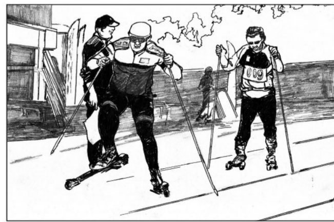
14 2019年5月,阿勒泰市成为2019年滑轮试点推广城市之一;阿勒泰地区举行“滑雪1000天·冲进冬奥会”动员大会。