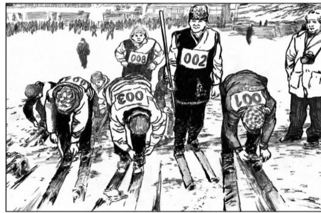
10 2016年1月,中哈俄高山滑雪友谊挑战赛“北京卡宾杯”第十一届阿勒泰国际古老滑雪比赛在阿勒泰市举行。