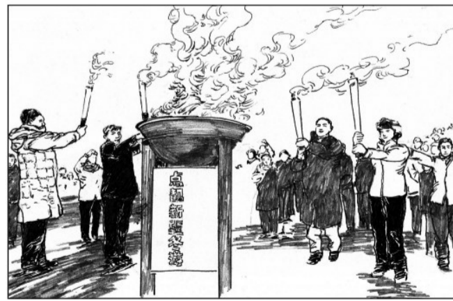
13 2018年10月,“冬游新疆·走进中国雪都阿勒泰”中国西部冰雪旅游节暨第十三届新疆冬季旅游产业交易博览会中国雪都首启仪式在阿勒泰市阿尔泰山野雪公园隆重举行,新疆冬季冰雪旅游拉开序幕,全国各地冬季旅游系列活动全面启动。