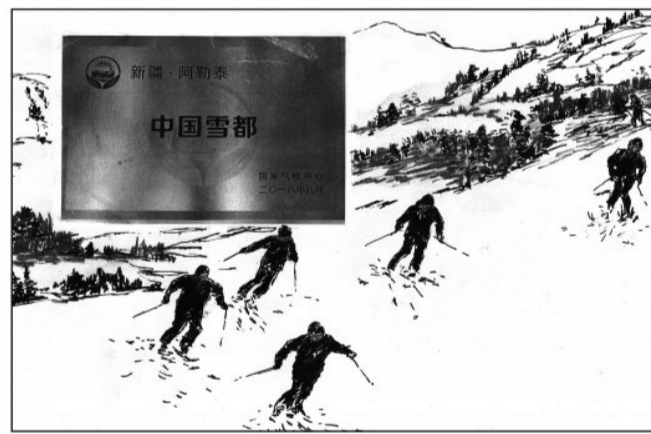
12 2018年8月,全国气候与气候变化标准化技术委员会评审通过《新疆阿勒泰市国家气候标志评估报告》,授予阿勒泰市“中国雪都”国家气候标志。

将军山滑雪场先后承接了国家高山队新疆组、国家越野滑雪队、天津越野滑雪队及北京西城区青少年队的训练,是全国及自治区高山滑雪训练基地、国家高山队认证的训练基地、自治区最高级别5S级滑雪场、自治区最佳滑雪旅游目的地、自治区优秀冰雪运动企业、自治区体育产业示范基地、全国十佳滑雪场,并且是新疆唯一有两条雪道通过国际雪联认证的雪场。