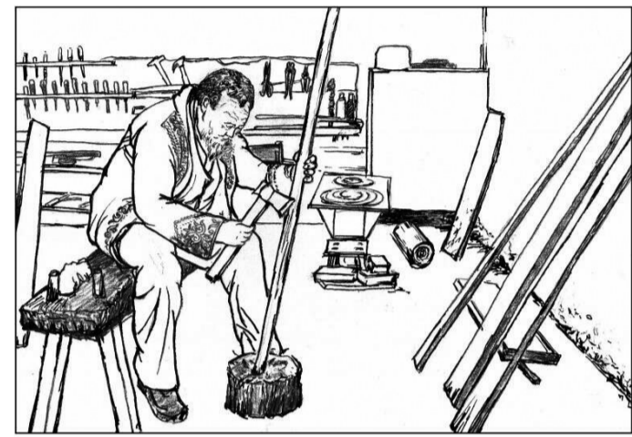
6 做好一副毛皮滑雪板大概需要15天,每一个制作环节都需要精湛的技艺和一定的经验。滑雪板板芯木材最好选用白松或红松,因其具有轻便、结实、不变形的特点。