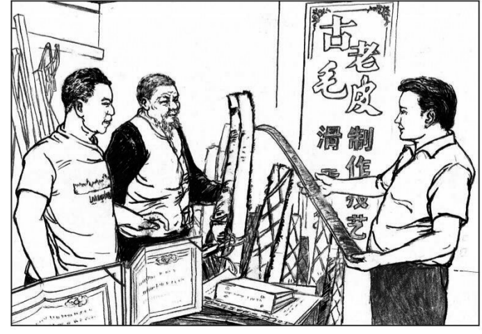
10 近年来,本地各级党委政府高度重视古老毛皮滑雪文化的传承和传播,积极引导,充分发挥现代传承人的技能优势,动员大家开办非遗家访,不仅让游客能够见证万年前古人的智慧,也能亲身体验非遗技艺的文化魅力。