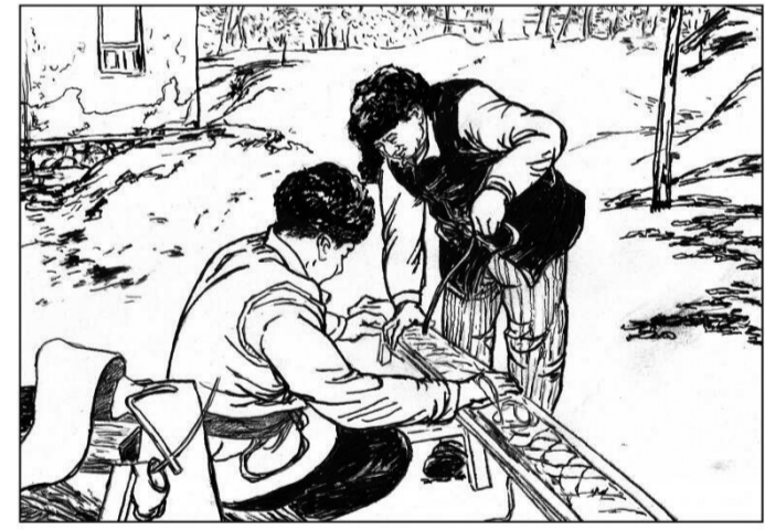
8 木板厚度在4厘米左右,宽度是使用者大拇指与食指自然打开的距离,长度视不同情形而定,在需拖行重物时长度为使用者身高加手长,无须拖物时依个人喜好。